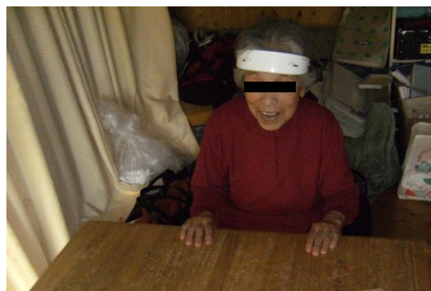
Fig. 2 脳血液量計測の様子